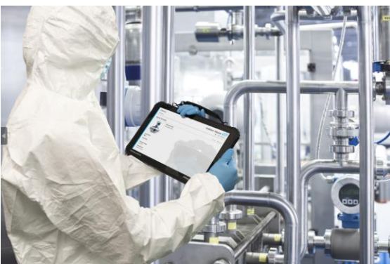
EH_Single Pair Ethernet_3.jpg

Single Pair Ethernet ermöglicht eine Bandbreite und Geschwindigkeit, die die Datenübertragung im Feld auf ein völlig neues Niveau hebt. Wartungs- und Betriebsleiter profitieren von neuen Erkenntnissen.