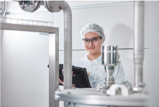
EH_Single Pair Ethernet_1.jpg

Dank der leistungsfähigen Datenverbindung, die die Ethernet-Technologie bietet, ist eine schnelle und umfangreiche Datenverarbeitung bis in die Feldebene möglich.