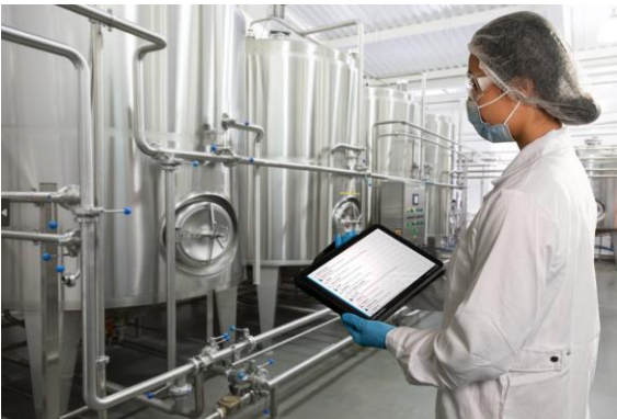
EH_Single Pair Ethernet_2.jpg

Dank der leistungsfähigen Datenverbindung, die die Ethernet-Technologie bietet, ist eine schnelle und umfangreiche Datenverarbeitung bis in die Feldebene möglich.